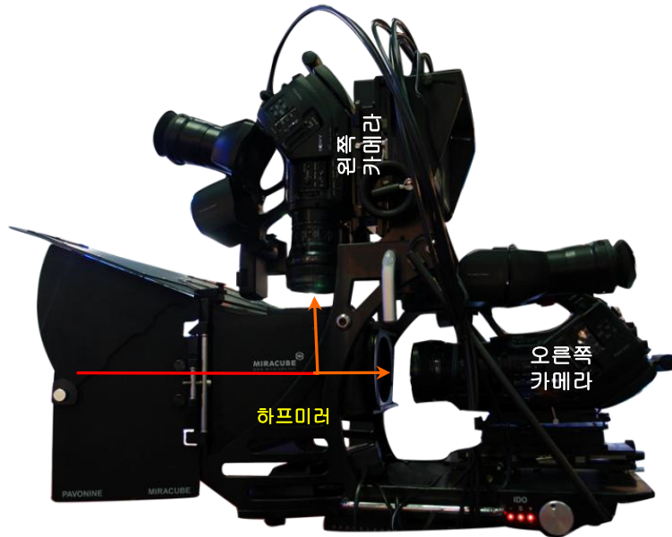
수평식 리그 - CMT 8000 시리즈 이미지