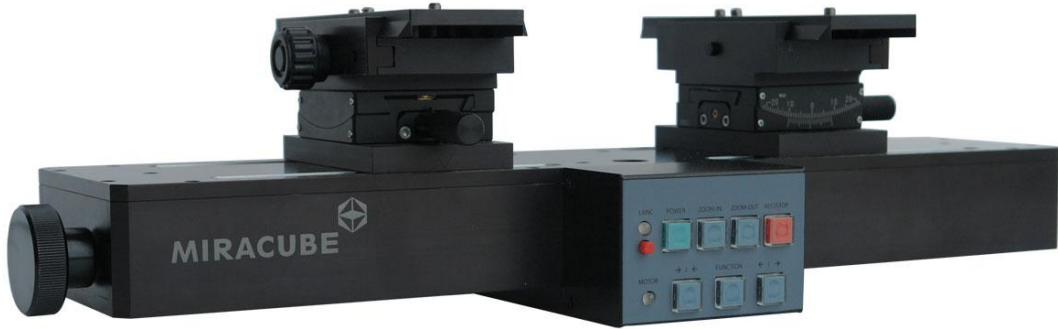
수평식 리그 - CMT 2000 시리즈 이미지